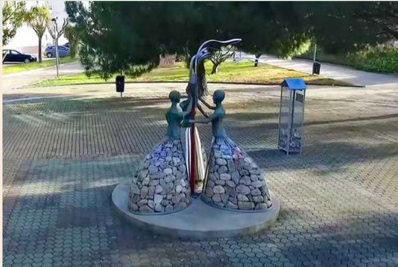
Imagen – Escultura Mujeres víctimas y resistentes, Lugar de Memoria, Peralta (Navarra)

Euskadi aprobó en 2023 la Ley 09/2023 de 28 de septiembre, de Memoria Histórica y Democrática de Euskadi [22], donde se dedica el capítulo VII a Lugares, espacios e itinerarios de memoria histórica de Euskadi , con una redacción que, al igual que en otras comunidades, menciona la memoria colectiva en la propia definición de Lugar de Memoria y también integra la defensa de valores y libertades democráticas. Además, agrega el concepto de Itinerario de la Memoria , que son conjuntos de más de un lugar de memoria, y señala en su artículo 29.3. que también se considerarán espacios de la memoria histórica de Euskadi los que se erigieron “en recuerdo, reconocimiento y reparación de las víctimas de aquella represión, por las familias de las víctimas, las asociaciones memorialistas, las instituciones y las administraciones públicas” (art. 29.1, Ley 09/2023).