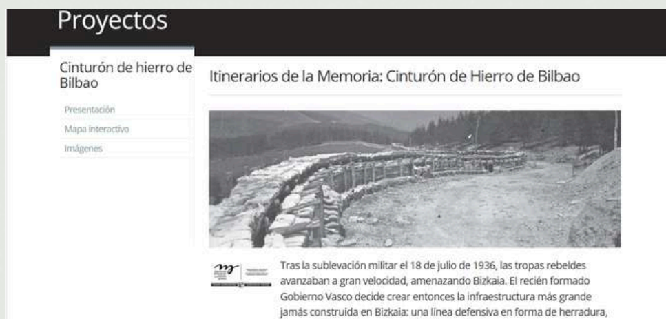
Imagen – Itinerario de la Memoria conocido como Cinturón de Hierro de Bilbao, Euskadi

Euskadi aprobó en 2023 la Ley 09/2023 de 28 de septiembre, de Memoria Histórica y Democrática de Euskadi [22], donde se dedica el capítulo VII a Lugares, espacios e itinerarios de memoria histórica de Euskadi , con una redacción que, al igual que en otras comunidades, menciona la memoria colectiva en la propia definición de Lugar de Memoria y también integra la defensa de valores y libertades democráticas. Además, agrega el concepto de Itinerario de la Memoria , que son conjuntos de más de un lugar de memoria, y señala en su artículo 29.3. que también se considerarán espacios de la memoria histórica de Euskadi los que se erigieron “en recuerdo, reconocimiento y reparación de las víctimas de aquella represión, por las familias de las víctimas, las asociaciones memorialistas, las instituciones y las administraciones públicas” (art. 29.1, Ley 09/2023).