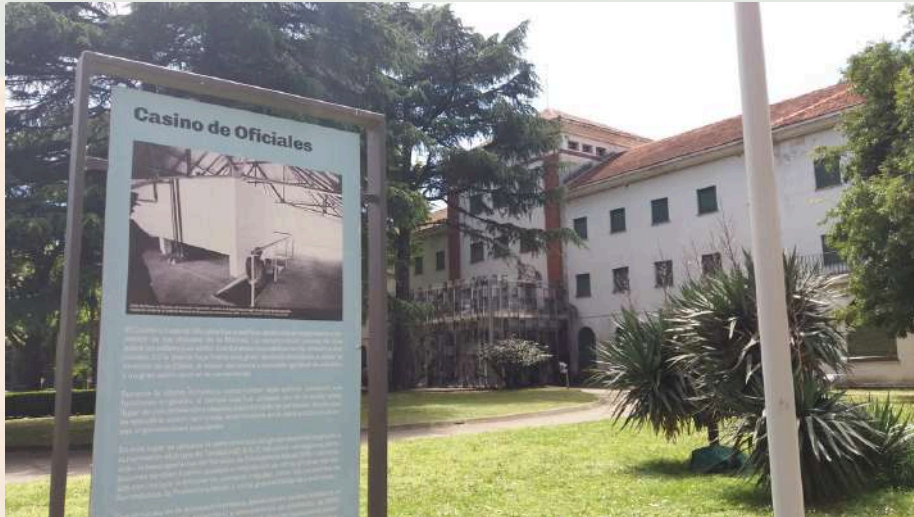
Imagen – Museo y Sitio de la Memoria ESMA, Buenos Aires. Fotografía de Mainer Marañá (2017)

Ese mismo año 2023, a solicitud de Ruanda, fueron inscritos los Sitios Conmemorativos del Genocidio: Nyamata, Murambi, Gisozi y Bisesero[10], que aglutinan cuatro espacios en recuerdo a las víctimas del genocidio de 1994. Los lugares inscritos integran más de 200 lugares de culto, lugares públicos y lugares de resistencia en Ruanda, donde se cometieron masacres, y son espacios conmemorativos orientados a la reconciliación.