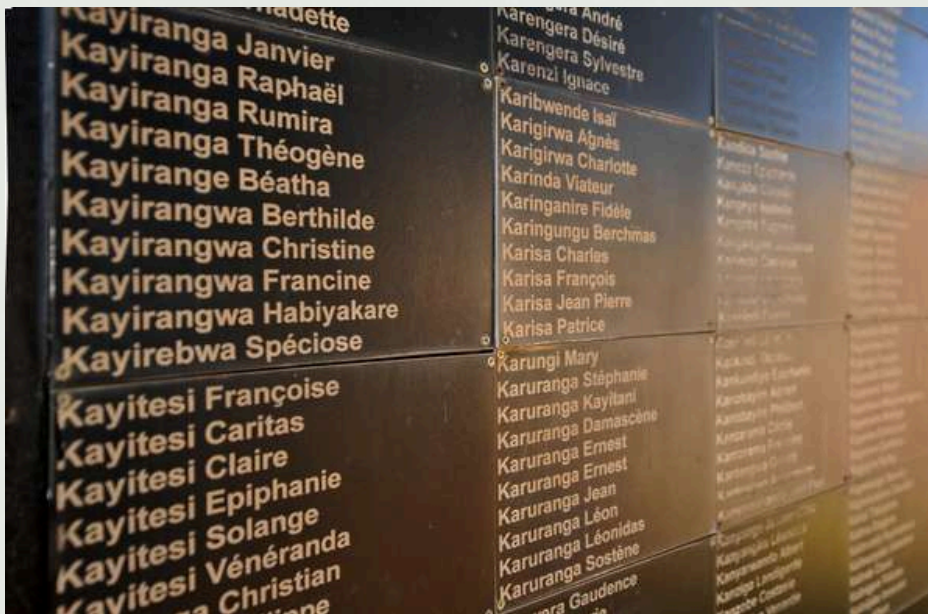
Imagen – Placa conmemorativa en Gisozi (Ruanda).

Ese mismo año 2023, a solicitud de Ruanda, fueron inscritos los Sitios Conmemorativos del Genocidio: Nyamata, Murambi, Gisozi y Bisesero[10], que aglutinan cuatro espacios en recuerdo a las víctimas del genocidio de 1994. Los lugares inscritos integran más de 200 lugares de culto, lugares públicos y lugares de resistencia en Ruanda, donde se cometieron masacres, y son espacios conmemorativos orientados a la reconciliación.