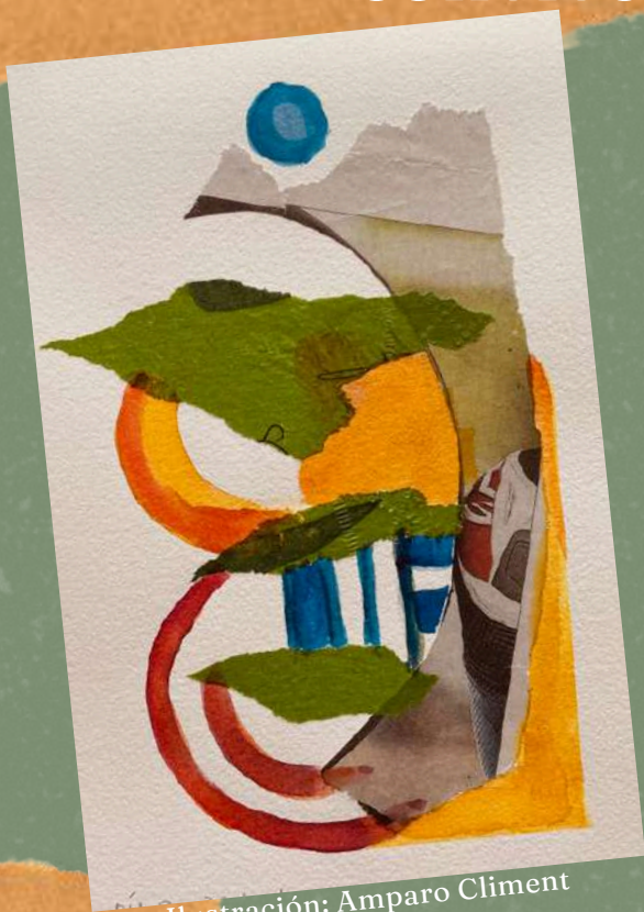
Ilustración: Amparo Climent