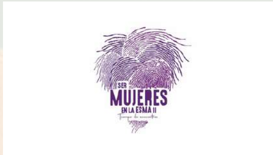
Imagen – Logo de la exhibición Ser Mujeres en la ESMA (Argentina).