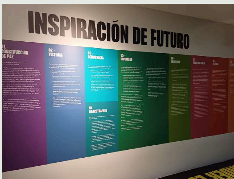
Imagen – Centro de Memoria. Bogotá (Colombia).

Asimismo, las narrativas más actuales y las nuevas tendencias en la interpretación de espacios vinculados a conflictos se centran más en la defensa de la paz, la presentación de mecanismos no violentos, en la resolución de conflictos y en la evidencia de las consecuencias de las guerras sobre la sociedad. Esto es, frente a anteriores discursos centrados en vencedores y vencidos, las nuevas narrativas tienden a poner a las víctimas en el centro y plantear perspectivas más ancladas en los Derechos Humanos.