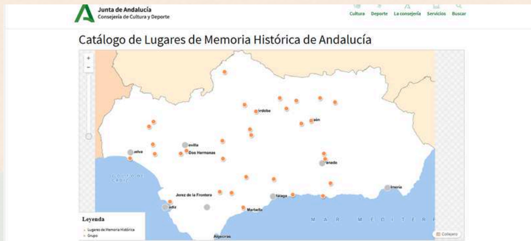
Imagen del Catálogo de Lugares de Memoria Histórica de Andalucía.

2017 se agrega la idea de memoria democrática al definir estos lugares y ya no solo se recogen aquellos vinculados a violaciones de derechos, sino que también se incluyen los que tienen relación con la lucha y defensa de las libertades. En Andalucía, se agrega la designación Sendero de Memoria Democrática, para los conjuntos de lugares.