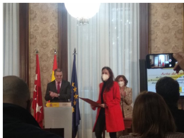
frente a la crisis del coronavirus, a la que se