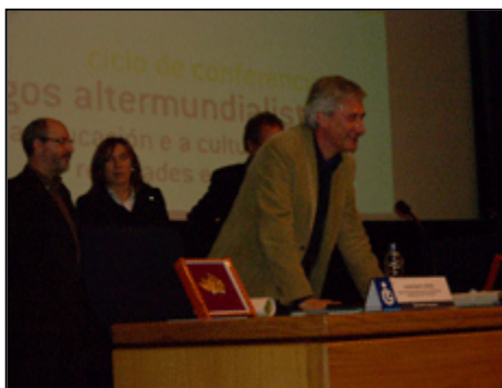
Entrega del Premio Portapaz