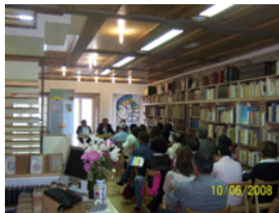
Acto presentación de libros Ciudadanía y DDHH

Las celebraciones del Día Internacional de los Derechos Humanos , del Día Escolar por la Paz , de los Diálogos Altermundialistas o de los Encuentros de Educación para la Paz , por citar las tradicionales citas anuales con la sociedad, merecen también, una valoración positiva. Junto con la campaña por la Laicidad del Estado, que se convirtió durante este curso en una de las actividades centrales, desarrollada en colaboración directa con asociaciones como Esculca, Xustiza e Sociedade o la Coordinadora de Crentes Galegos. Esta campaña fructificó en el nacimiento de una plataforma laica unitaria denominada Galicia Laica.