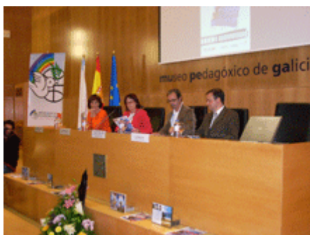
Acto Presentación del Audiovisual en las aulas

Continuó desarrollándose el servicio público de videoteca y biblioteca ecopacifista especializada, accesible desde la web con películas, unidades didácticas y asesoramiento para abordar los conflictos por medio del cine, el préstamo de libros y filmes a centros educativos, entidades, particulares, etc.. Se colaboró con el programa "El audiovisual en las aulas" del Consorcio Audiovisual de Galicia, los cursos de formación sobre "Cine para convivir" y la dotación de películas en gallego a los centros escolares. En este curso: Pérez el ratoncito , para infantil y primaria y Para que no me olvides , dirigida a secundaria. Las dos con sus correspondientes unidades didácticas gracias a la colaboración de la Dirección Xeral de Política Lingüística de la Xunta de Galicia y al Consorcio Audiovisual Galego.