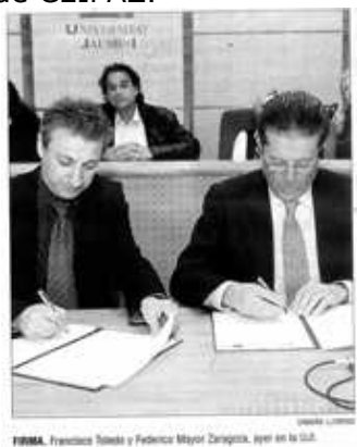
FIRMA. Francisco Toledo y Federico Mayor Zaragoza, ayer en la UJ.