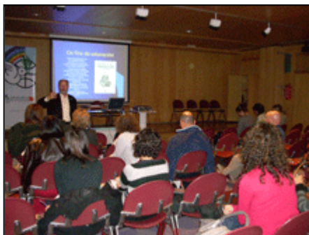
Curso ANPAS dentro programa de actividades del Día Internacional de los DDHH