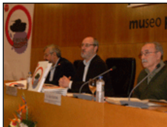
Presentación Campaña Día Escolar Paz