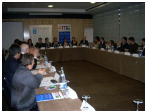
Reunión constitutiva Comité Organizador Foro 2010(Marzo 2008)

El 28 de marzo se constituyó oficialmente el Comité Organizador del Foro 2010 en Compostela, acto presidido por D. Federico Mayor Zaragoza y con la colaboración de más de 20 organizaciones e institutos de investigación para la paz, del Estado Español y de Portugal.