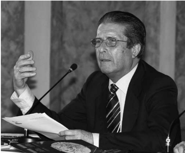
Federico Mayor Zaragoza Barcelona, 27 de gener de 1934